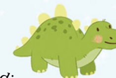
dinosaurio de juguete