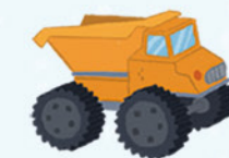
camión de juguete